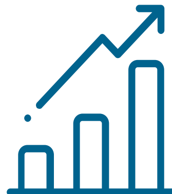
Image Building wil dé toonaangevende partner zijn in duurzame buitenreclame, waarbij innovatie, kwaliteit en milieubewustzijn hand in hand gaan. Wij streven naar een toekomst waarin tijdelijke reclameconstructies niet alleen effectief en flexibel zijn, maar ook bijdragen aan het verminderen van milieubelasting door hergebruik en recycling.